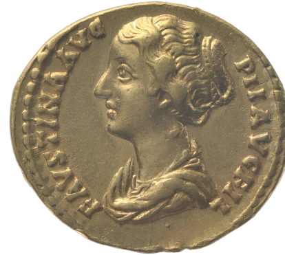
2 Goldmünze mit Porträt der Faustina Minor (Ehefrau Marc Aurels), 2. Jahrhundert n. Chr.