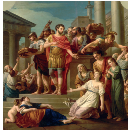
3 Gemälde von Joseph Marie Vien, Marc Aurèle secourant le peuple, 1765

Regierende, Staatstheoretiker, Philosophen und Kunstschaffende beziehen sich seit Jahrhunderten auf Marc Aurel und seine „Selbstbetrachtungen“. Ausgehend von dieser Rezeptionsgeschichte zeigt das Stadtmuseum Simeonstift anhand hochkarätiger Ausstellungsstücke, wie sich die künstlerischen Darstellungen von guter Regierung im Laufe der Geschichte gewandelt haben: Wann gilt eine Herrschaft als gut und gerecht? Welchen Widerhall finden diese Ideen in der Kunst? Die Gemälde, Skulpturen, Karikaturen und Medien aus acht Jahrhunderten beleuchten diese Frage als eine faszinierende Konstante der Menschheitsgeschichte mit großer Aktualität.