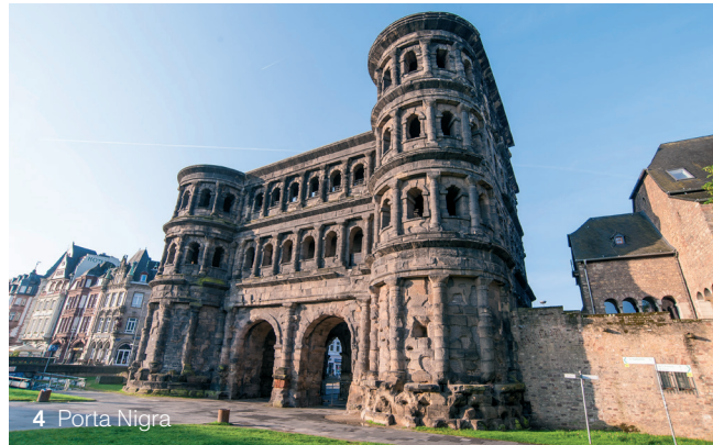
4 Porta Nigra

Trier begeistert alle, die sich für die Antike interessieren – denn nirgendwo sonst in Mitteleuropa kommt man dem Glanz des römischen Imperiums näher als hier, im Zentrum der Antike. Zur Zeit Marc Aurels kam Augusta Treverorum, die älteste Stadt Deutschlands, zu einer ersten großen Blüte. In dieser Epoche entstand auch die Stadtbefestigung und mit ihr die Porta Nigra, das antike Stadttor, das bis heute Wahrzeichen Triers ist. Die Stadt beeindruckt mit ihren monumentalen Römerbauten, die zum UNESCO-Weltkulturerbe zählen und die Antike lebendig werden lassen.