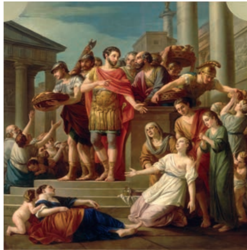
4 Gemälde von Joseph Marie Vien, Marc Aurèle secourant le peuple, 1765