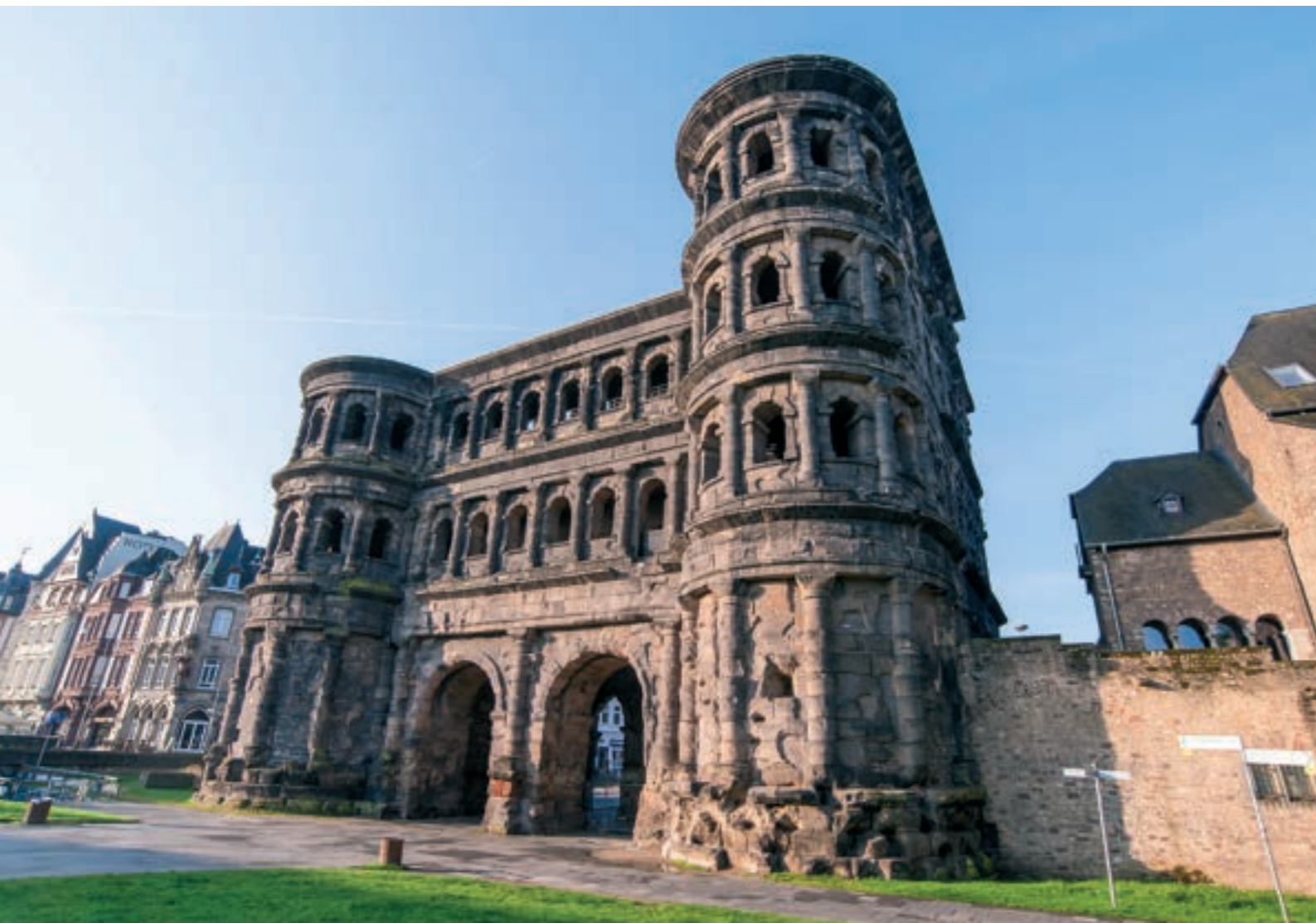
5 Porta Nigra

* Gültig eine Woche ab Kauf, keine zusätzlichen Ermäßigungen