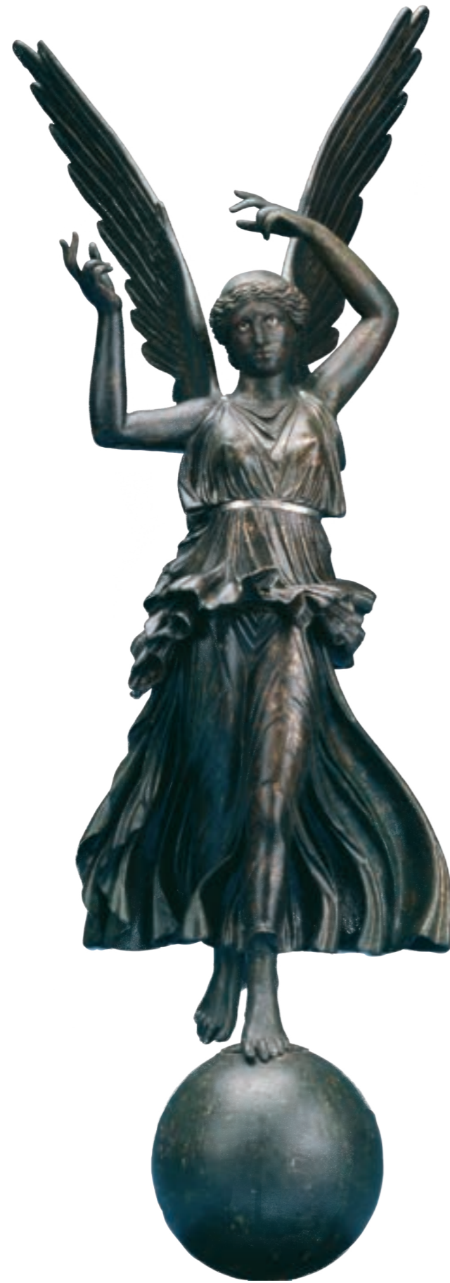
2 Victoria von Fossombrone, 2. Jh. n. Chr.