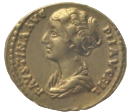
1 Goldmünze mit Porträt der Faustina Minor (Ehefrau des Marc Aurel), 2. Jh. n. Chr.

Marc Aurels Lebenszeit ist gezeichnet von Gegensätzen: Während die langen Jahre als Thronfolger überwiegend friedlich waren, ist seine Regentschaft als Kaiser von erbitterten Kriegen und Feldzügen geprägt. Vor allem aber seine Liebe zur Philosophie und seine „Selbstbetrachtungen“ machen ihn zur Ausnahmeerscheinung der Antike und heben ihn von anderen Herrschern seiner Zeit ab. Im Landesmuseum illustrieren mehrere hundert wertvolle Spitzenexponate aus zahlreichen europäischen Museen die Lebensstationen Marc Aurels und machen die Zeit seiner Herrschaft lebendig.